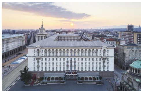
Hotel Sofia Balkan Palace

UWAGA: Dla zainteresowanych możliwość wykupienia ubezpieczenia od rezygnacji (KR). Decyzję o zakupie tej polisy należy zgłaszać przy zapisie na wycieczkę.