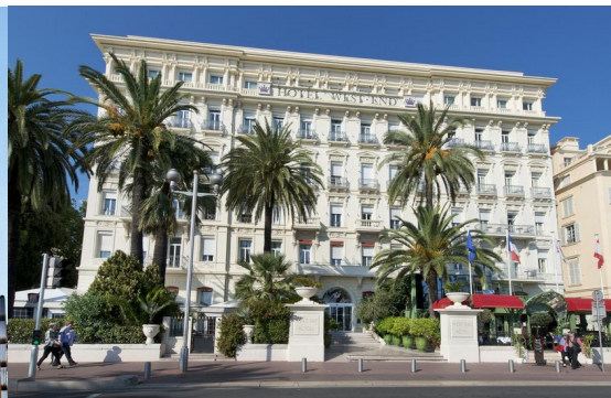
Hotel West End