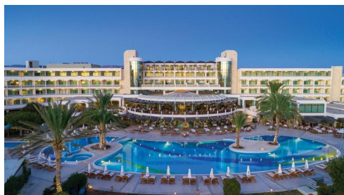
Hotel Athena Beach

Uwaga! Program zwiedzania ma charakter ramowy, kolejność może ulec zmianie.